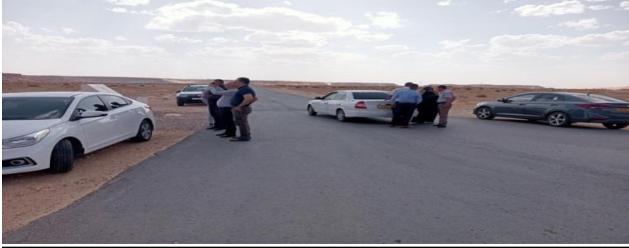
1 منطقة صغيرة (10 هكتار)

منطقة نشاطات مصغرة واحدة (01) بمساحة (10 هكتار) مخصصة للاستثمارات الصغيرة (المؤسسات المصغرة والبناء والتجارة)