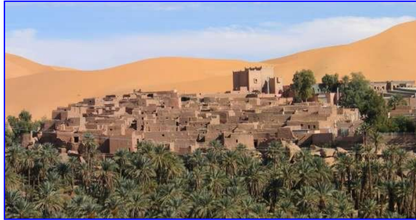
قصر بني عباس