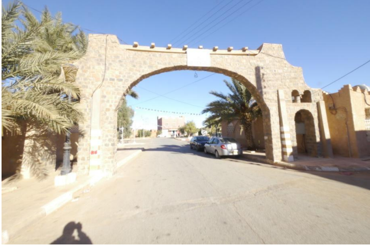
وقع بلدية IGLI